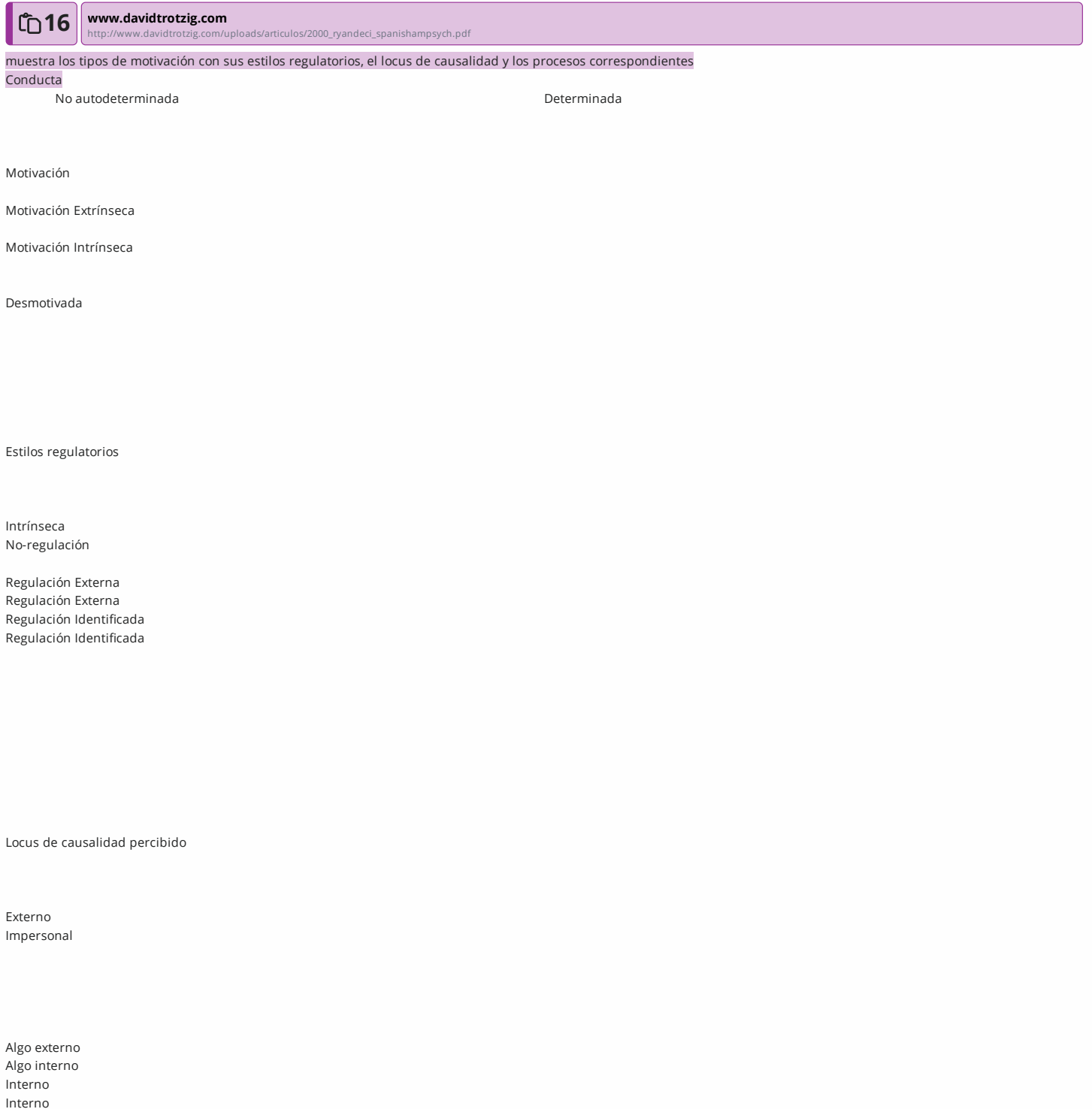
FIGURA 1. El continuo de la Autodeterminación que va desde la conducta desmotivada a la motivación intrínseca o autónoma, además

demás; es decir habrá menor motivación intrínseca si los niños sienten que sus maestros son indiferentes o fríos, por lo tanto, no se cumplirá su necesidad de relación. Por su parte, Jiménez (2007), señala que la motivación intrínseca es la intensidad y persistencia que tiene una persona al realizar ciertas actividades sin necesidad de verse presionada o influida por factores externos, como presión, recompensas, etc. Los estudiantes que están motivados intrínsecamente por lo que realizan, lo perciben como significativo, interesante, que requiere de sus habilidades, de su criterio, de su autonomía y que les hace desarrollarse y crecer personalmente (Orbegoso, 2016). Entonces, hablar de motivación se entiende como un continuo que va desde la desmotivación o amotivación hasta la motivación autónoma o intrínseca como se observa en la figura 1.