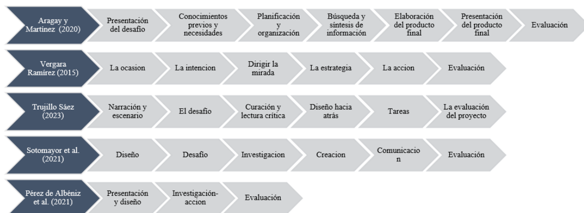
Figura 3. Etapas de implementación del ABP según diferentes autores

Nota: Esta figura evidencia las diferentes perspectivas de autores sobre cómo implementar el ABP en el aula. Adaptado de Fundación Chile (2021) y Pérez de Albéniz Iturraga et al. (2021), Trujillo Sáez (2023) y Unicef (2020)