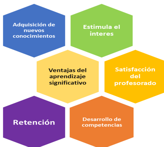
Gráfico 4. Ventajas del aprendizaje significativo.

Bolívar (2009) menciona que el aprendizaje significativo tiene la ventaja de que a los alumnos se facilita el poder adquirir nuevos conocimientos relacionados con los ya asimilados significativamente, lo cual implica tener una retención más duradera de la información, al tratarse de un aprendizaje activo, ya que depende de la asimilación deliberada de las actividades del alumno y es personal, por lo cual la significación de los aprendizajes de un estudiante determinado depende de sus propios recursos cognitivos como se puede apreciar en el Gráfico 4.