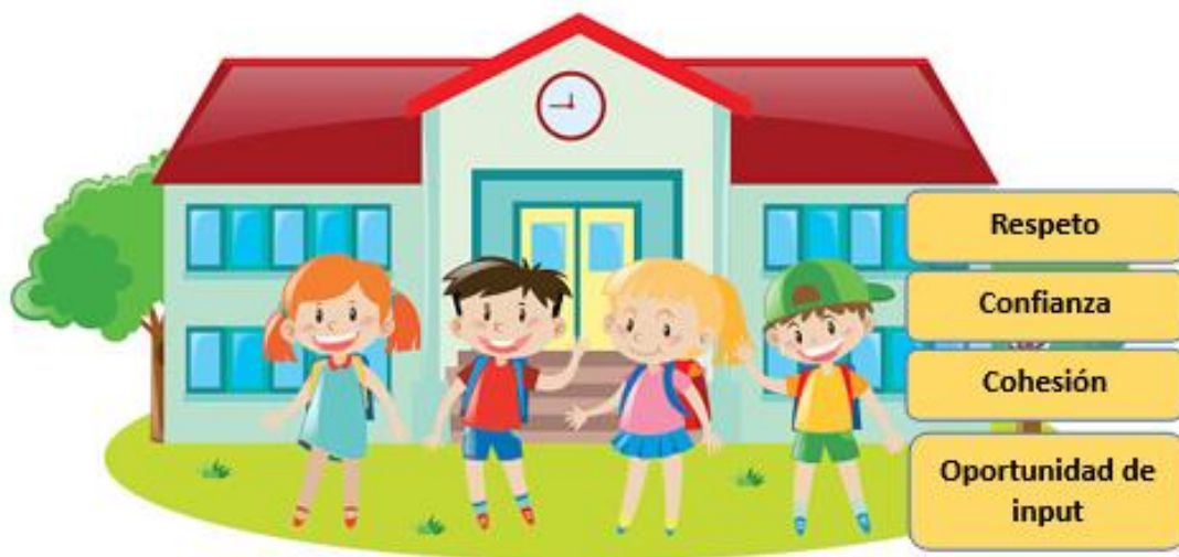
Gráfico 1. Características del clima positivo.

En el presente Gráfico 1 se puede apreciar las siguientes características de un clima escolar positivo: