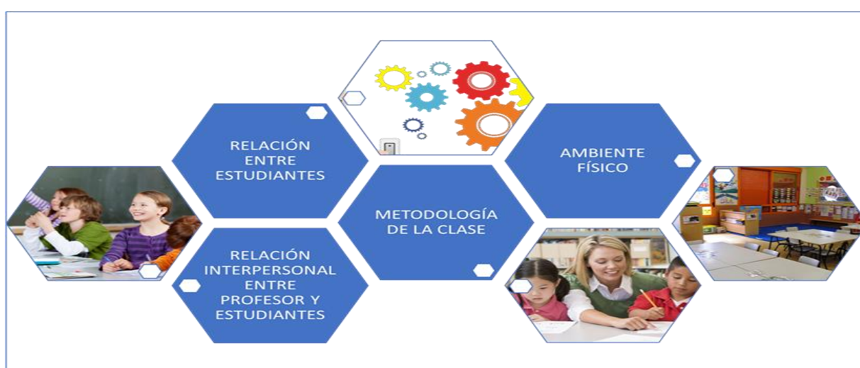
Gráfico 2. Factores de un clima escolar positivo.

Fuente: Elaboración propia, 2023. Basado en Ríos et al. (2010).