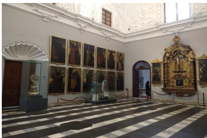
(Museo Convento San Francisco de Lima)

Además de ello, los estudiantes pueden conocer las catacumbas albergadas en el interior del conjunto arquitectónico. Estas servían como cementerio en la época colonial y se han convertido en una de las atracciones más famosas del convento. Los estudiantes pueden explorar este lugar y aprender sobre la historia de Lima y sus tradiciones funerarias. De esta forma, la visita al Museo Convento de San Francisco de Lima ofrece a los estudiantes la oportunidad de sumergirse en la historia, la cultura y la arquitectura colonial, así como aprender sobre la importancia del patrimonio religioso y colonial.