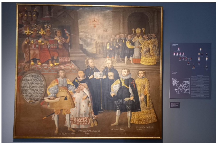
(Fotografía tomada en el Museo Pedro de Osma, sala Arte del Sur Andino)

Otro ejemplo son las monedas que se exponen en el Museo Numismático del Perú. Este museo busca que los visitantes conozcan desde la fabricación de las monedas hasta las distintas monedas que ha tenido el Perú a lo largo de su historia. Mediante sus piezas los estudiantes pueden conocer el origen de las monedas en el Perú, la creación de la Casa de la Moneda, las primeras monedas acuñadas, las monedas conmemorativas, la creación del Banco Central de Reserva del Perú o el proceso de acuñación de monedas en la actualidad (Museo Central, 2024). Todo ello con el objetivo de promover el diálogo en torno a temas como la forma, diseño, material, usos, proceso de acuñación, tecnología, cambios e importancia de las monedas en la economía; así como, propiciar el diálogo en torno a la importancia de las personas o figuras que aparecen en ellas.