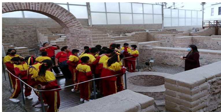
(Fotografía de mediación cultural tomada en el Museo de Sitio Bodega y Quadra)

tiempo, pueden incluir un taller con el que se refuerza el vínculo y los contenidos que se han visto durante el recorrido al museo.